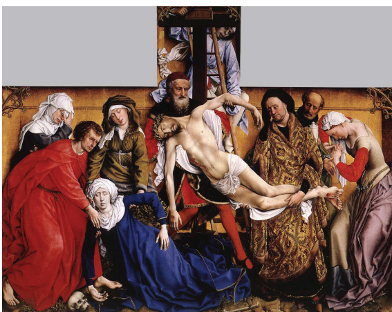
Rogier van der Weyden: Krisztus levétele a keresztről (1435-38)

Egyházi ünnepeink nagy terhet rónak az igehirdetéssel szolgáló lelképásztorok vállára. Annak ellenére, hogy az igehirdetés minősége és relevanciája az ünnep központi jelensége kellene, hogy legyen, az arra való készülés – a sok másodlagos elfoglaltság mellett – nem mindig kap megfelelő és elegendő időt. Legtöbb esetben a sablonosság és az újszerűség görcsös keresése jelentik a legnagyobb kisértést a készülés során. Az egy napos kurzus célja, hogy a lelképásztorok átfogó összefoglalást kapjanak az advent és karácsony dogmatikai háttéréről, szociológiai beágyazottságáról, liturgiai lehetőségeiről, és előre kiadott, a Bibliaolvasó kalauz és az Igazság és Élet javasolt textusairól való előzetes és a kurzus során közös készüléssel keressék az ünnepek mélyebb és releváns mondanivalóját, üzenetét, aktualitását.